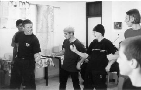
Jongeren uit Nieuw Zeeland en Israël leren elkaar kennen.

Een christelijke jeugdgroep uit Nieuw Zeeland vroeg ons kortgeleden of er ook een gelegenheid was tijdens hun korte bezoek aan Israël iets te betekenen voor de Israëlische jeugd. Voor hen werd een bezoek georganiseerd aan een tehuis waar jeugd opgevangen wordt uit problematische gezinnen.