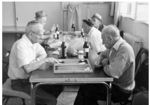
Oudere Israëliërs spelen backgammon in een gemeenschaps-centrum.

Het proces van ouder worden is voor de meesten van ons niet zo gemakkelijk. Het dwingt ons er toe om onze beperktheden onder ogen te zien. Sommigen onder ons zijn goed gezond, hebben geliefden en genoeg op tafel. Diegenen die dit niet kunnen zeggen, staan voor vele uitdagingen. Wij krijgen veel aanvragen van ouderen die nauwelijks in staat zijn de eindjes aan elkaar te knopen en die zich erg eenzaam voelen. Toen we kortgeleden de gelegenheid kregen om een gezellige avond te financieren voor deze behoeftige ouderen, waren we blij hen te kunnen helpen. De directeur van het buurtcentrum had niet genoeg woorden om ons te bedanken en bleef maar zeggen dat het veel had betekend voor iedereen. De uitdrukking op de gezichten van de aanwezigen bracht dezelfde boodschap over. We willen u danken voor uw hulp om ons in staat te stellen hun dagen enigszins op te vrolijken.