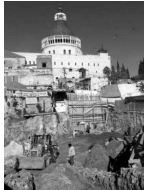
De moskee in aanbouw

Deze aanstootgevende uitspraak zal zichtbaar zijn op de enorme moskee die wordt gebouwd vlak naast de kerk van Maria Boodschap te Nazaret - waar de engel Gabriël de komst van onze Redder