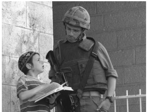
Jongen leest soldaat voor uit Torah

'Hoor, Israël! Gij staat thans vlak voor de strijd tegen uw vijanden; laat uw hart niet week worden, vreest niet, wordt niet angstig en siddert niet voor hen, want de Here, uw God, is het, die met u gaat om voor u te strijden tegen uw vijanden, teneinde u de overwinning te geven' (Deuteronomium 20:3,4).