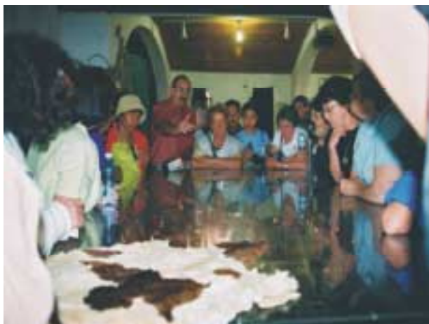
De deelnemers krijgen uitleg

Daarna gingen we verder naar de Settlements, waar een paar mensen bezig waren, om een bestaan op te bouwen. Ze hadden een aantal schapen, om daarmee meer recht op land te krijgen. Toen ze eens een groot aantal schapen hadden gefokt, werden die op een nacht gestolen. Ja, en dan toch maar weer de moed hebben om opnieuw te beginnen. Het frappeerde mij, dat die mensen zeer hoog opgeleide mensen waren, die bewust voor een eenvoudig bestaan als settler en schaapherder hadden gekozen. Wij hoorden van onze gids Inge dat de afgelopen 3 jaar, sinds de 2e intifada, er alleen christenen waren geweest die hun eens hadden opgezocht.