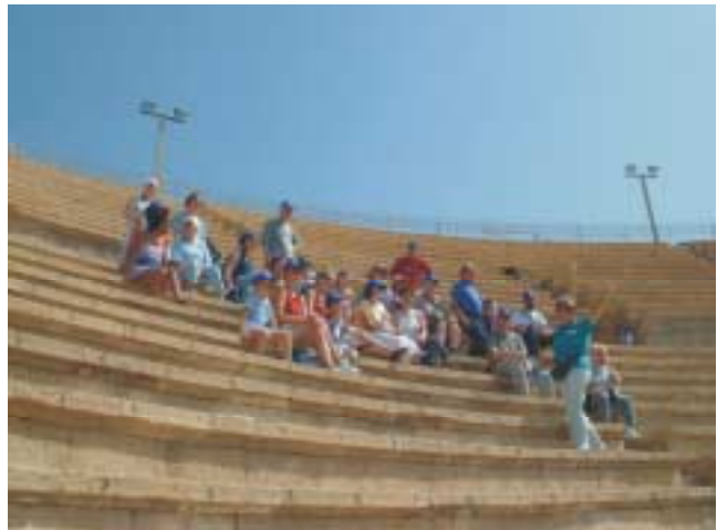
De deel van de groep zit bij elkaar in het grote Romeinse theater

Na een korte, maar heerlijke nachtrust en een feestelijk ontbijt in het Talhotel in Tel-Aviv, begonnen we aan onze eerste dag in Israël. De bus in, en via de Via Mare, de kustweg, naar het noorden. Onze eerste bestemming was Ceasarea. Vanuit de heerlijk koele bus liepen we het opgravingsterrein op. We zaten op de trappen van het ronde, stenen theater, waarin Jezus' tijd heel wat decadente niet -joodse toneelspelen zijn opgevoerd. In het naastgelegen langwerpige amfitheater werden in die tijd races en andere wedstrijden gehouden. Herodes de Grote bouwde dit theater en amfitheater vlakbij zijn, aan zee geleden, paleis. Van dat paleis zagen we alleen nog de in zee weggezonden restanten. Behalve een groot bouwer (o.a. ook een haven met lange pier, waar ook Paulus aan boord stapte) was Herodes ook een grote machtswellusteling en moordenaar van ieder die zijn troon zou kunnen bedreigen.