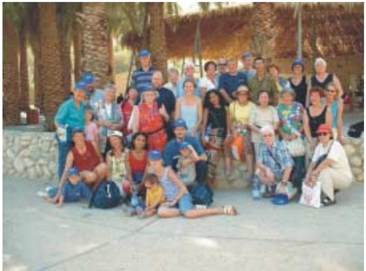
De deelnemers van de reis en de gids bij elkaar voor de groepsfoto

Voordat we klaar waren met eten hoorden we dat het programma begon. De atmosfeer van 'overleven' slaat om in 'beleven'. De muziek en dans brengt een stemming van aanbidding. De wind van Gods Geest waaide rijkelijk. Vooral de zuid Amerikaanse deelnemers gaan 'uit hun dak' voor Jezus. Als nuchtere Nederlanders kunnen we daar nog wel iets van leren.