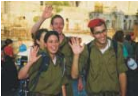
Toeschouwers waren er in alle soorten en maten

zich zouden verzamelen voor de mars. Onderweg werden we al gegroet door de joodse mensen! Er was een "exitement in the air" terwijl wij ons verzamelden in het park, wachtende op de dingen die zouden komen. Andere Nederlanders voegden zich bij ons. Sommigen bekend en sommigen niet bekend. Het werd tenslotte nog een hele groep eigenlijk. Rond de 100. We vermaakten ons prima. Er werden foto's genomen (natuurlijk), ballonnen werden opgeblazen en drie jonge vrouwen gingen rond met 3 verschillende kleuren lippenstift om de hollandse vlag op een of twee van onze wangen te tekenen. Erg gezellig allemaal.