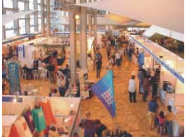
Tijdens het congres waren er vele stands

We gingen daarna met een paar anderen van onze groep naar het Congres Gebouw. Om 10.00 uur begon het Seminar o.l.v. ds. Paul en Nuala O'Higgins over Zegeningen en vervloeking (zie Gen 12:2 en 3, Gal 3:13, Deut.28 en Jes.53). In het gebed, dat werd uitgesproken, werd gevraagd om verbreking van de vloek, die al eeuwen op ons lag, ook door de zonden van onze voorvaders. Jezus heeft ons hiervan vrijgesteld. In de pauze ontmoette ik mijn buurvrouw uit het hotel, Jantsje, en samen gingen we op weg naar een bank om te pinnen. We moesten, onder een tunneltje door, naar het busstation! Er is daar enige tijd geleden ook een aanslag gepleegd en ik was panisch van busstations. Na de noodzakelijke controles konden we naar binnen, pinden ons geld en dronken gezellig samen koffie met gebak in de cafetaria daar. Als je me dat een week geleden had verteld zou ik het niet geloofd hebben. Maar Jezus geneest ook van angst! We deden daarna samen nog wat boodschappen in een supermarkt en gingen weer naar het Congres-gebouw. Jaap had daar intussen een mooie das gezien. We deden dus meteen onze boodschappen bij de stands in de hal daar. Wat een prachtige dingen allemaal!. Daarna gingen we te voet met Jacob en onze gids Inge terug naar het hotel.