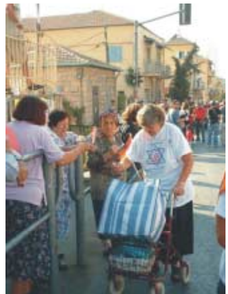
Traditiegetrouw worden er weer zijden tulpjes uitgedeeld

Ineens was het tijd om te gaan lopen in de mars. Het begon echt!! Direct kwamen er al kinderen vragen om vlaggetjes. We hadden het advies gekregen om ze niet allemaal direct te gaan uit delen aan het begin van de mars. Het was zo bijzonder om door de straten van Jeruzalem te mogen lopen en de joodse mensen te mogen bemoedigen en te ondersteunen alleen al door onze aanwezigheid en de aanwezigheid van de Heer door ons allemaal heen. Het was een blijde optocht. De Heer liep met ons mee en Zijn glimlach en liefde en vreugde werd doorgegeven