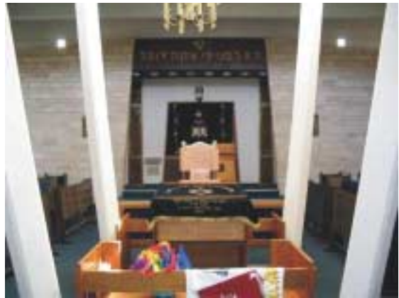
Interieur synagoge te Jeruzalem