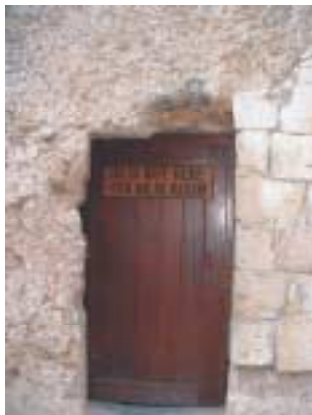
Hij leeft, het graf is leeg

's Middags ging een groot gedeelte van onze groep naar de graftuin. Daarvoor gingen we nog naar een andere plek waar misschien het graf van Jezus is geweest. Daar is een kerk overheen gebouwd. Het was een hele mooie kerk. Ook kon je nog stukken zien van de 'echte' rots. Daarna gingen we naar de plek waar Pilatus heeft recht gesproken over Jezus. Ondertussen liepen we over de weg waar Jezus ook heeft gelopen met zijn kruis. Die weg heet Via Dolorosa. Op de plek waar Pilatus Jezus heeft veroordeeld hingen mooie schilderijen. We hebben er ook met elkaar gebeden en gedankt.