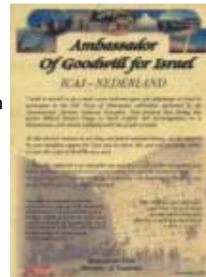
Het certificate of Appreciation voor de ICAJ

In Jeremia 20:7 staat dat God niet is geïnteresseerd in woorden, maar in daden. God is er niet blij mee, wat we hebben gedaan, maar wat we zullen gaan doen. In Habakuk 1:2 vraagt Habakuk: " God, wat gaat u er aan doen?" Maar de dingen werden alleen maar erger. God antwoordt op Zijn tijd en op Zijn manier. In vers 6 staat dat Hij een slecht volk (de Chaldeëen) gaat sturen, om Israël tot de orde te roepen. Habakuk vraagt: "God kunt U dat doen?" Als God met een volk afrekent, hoe doet Hij dat dan? Maar God weet wat Hij doet. God is Zijn Kerk aan het hervormen, dwars door vuur heen. En soms doet dat pijn. Soms begint het met een mens die verbroken moet worden.