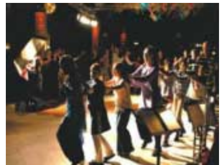
Soekah Party in Ramat Rachel