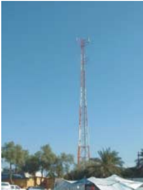
De laagst gelegen GSM mast op deze aarde