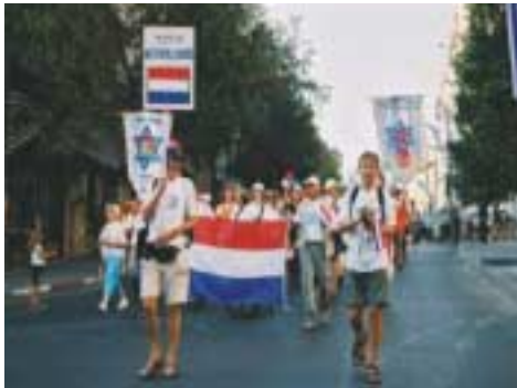
Ongeveer 80 nederlandse deelnemers liepen mee in de Jeruzalem mars

Achter elkaar aan liepen we naar het Sachar Park,