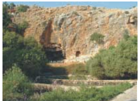
Banias: de grotten van de bosgod Pan

Jezus kwam hier bewust om de afgodendienst ten toon te stellen aan de wereld. Daartegenover stond die belijdenis van Petrus. Petra = rots. De rots waarop de gemeente gebouwd wordt. Dit bezoek sloten we af met het lied: U bent Heer. Vanaf hier weer terug naar de Kibbutz.