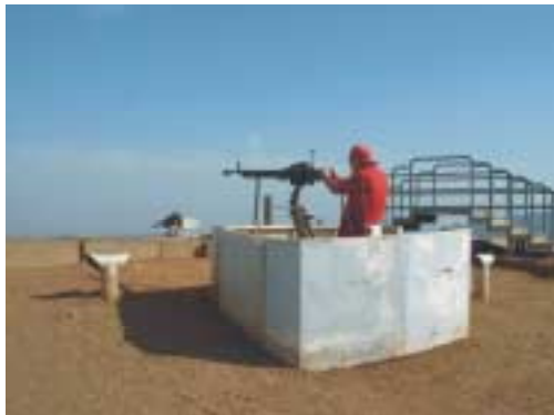
'Kapitein Roodbaard' houdt Syrië in de gaten

Kapernaum. Ondanks de 'shorts' mochten we het oude historische stadje Kfarnaum binnen. De geboorteplaats van Petrus. We bezochten de resten van een synagoge. Hier zou de plek zijn waar de vier vrienden hun zieke vriend door het dak lieten zakken en Jezus zei: uw zonden zijn u vergeven en hij werd ook genezen.