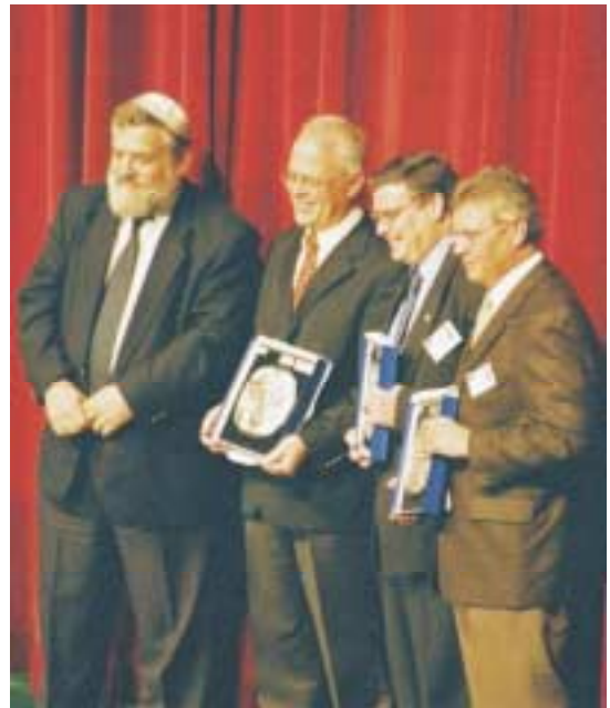
De minister van Toerisme bood de reisleiders een certificaat aan

De spreker voor de avond was Dr Kenneth Meshoe, MP, leider van de Afrikaanse Christelijk Democratische Party en Lid van het Parlement van Zuid Afrika en voorganger van een bloeiende gemeente in Johannesburg. Hij haalde Lucas 22:39 aan : "Hij ging zoals Hij gewoon was naar de Olijfberg, en zei tot hen: Bidt, dat gij niet in verzoeking komt." Dit geldt ook voor ons: "" Bidt Jeruzalem vrede toe: mogen wie u liefhebben, rust genieten. (Ps.122:6 ). "Wij zijn hier niet voor sightseeing, maar om te bidden voor de Vrede van Jeruzalem. Wij zijn niet geïnteresseerd in politieke correctie, maar in Bijbelse correctie." Zijn voeten zullen staan op de Olijfberg". (Zach 14:4).