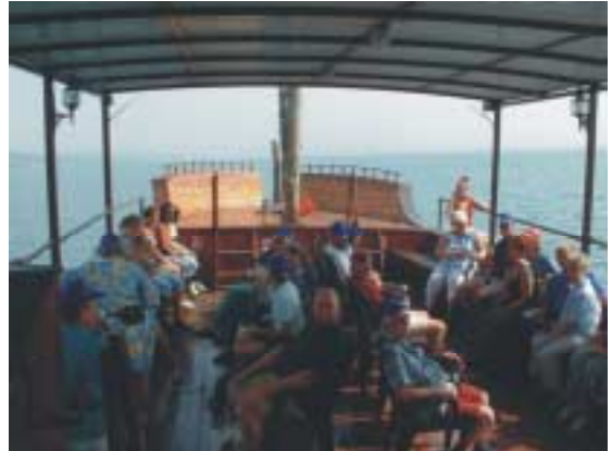
Boottocht over het meer van Galilea

Tien voor zeven werden we gewekt, heerlijk geslapen. Op naar het ontbijt. Tjonge jonge, sommigen kunnen wat verstouwen zo vroeg. Jacob, stelde voor buiten om 7.45 uur bij elkaar te komen. Dat werd dus 8 uur. Regga Regga. Math.4:12-22 werd voorgelezen: Jezus wandelde langs het meer. Kun je je voorstellen dat we daar nu zitten aan dat meer. De dag werd aan God opgedragen. Met een half uurtje vertraging vertrokken we met de bus richting Tiberias, langs het meer, de longen van Israël. In het meer leven 20 soorten vis, waaronder de Petrusvis. Bij Ginnosar gingen we op de boot. Geen luxejacht, maar een oud houten schip. We kiezen het ruime sop richting Kapernaum, de stad van de Troost. We zijn langs de kerk van "brood en vis" gevaren. Op die plek zou Jezus de zaligsprekingen hebben uitgesproken. Midden op het meer werd de motor van de boot stopgezet. Zoals de discipelen het net aan de andere kant uit moesten gooien. Zo kunnen wij ook nu onze netten aan de andere kant uitgooien. Als het ware een nieuwe verdieping van ons geloof. Een moment van gebed en bezinning. Glorie aan God.