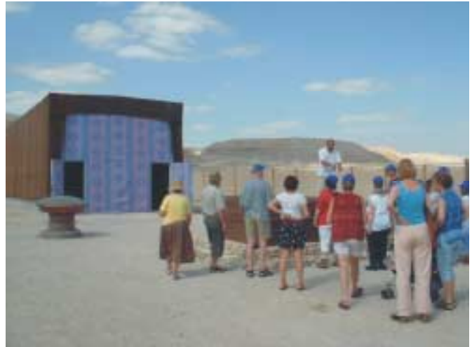
Een replica van de Tabernakel van Mozes