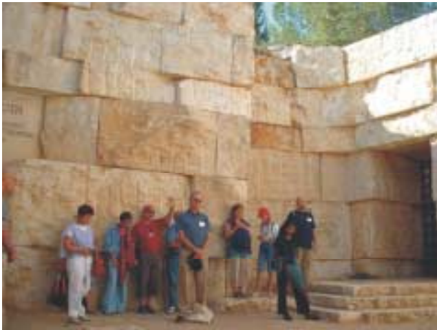
Voorbede voor het joodse volk in de Valei der Natiën bij Yad VaShem

De groep vertrok naar Yad Vashem, maar aangezien we er al tweemaal geweest zijn en het te emotioneel vonden, hebben we de voorkeur gegeven aan een rustige middag in onze hotelkamer met schitterend uitzicht op Jeruzalem.