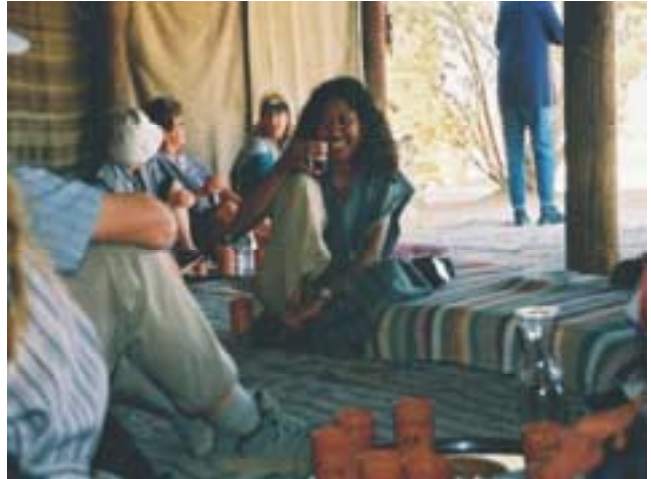
De deelnemers aan de excursie genieten van het drinken

Direct na de ochtend seminars konden we met speciale bussen mee naar de Settlements of naar de projecten van de Social Assistance van de ICAJ. Ik ben met de tour geweest naar de Settlements, vlak bij Jeruzalem. Eerst hadden we een korte stop bij de tent van Abraham. De knecht van Abraham, Eliezer, kwam ons tegemoet met water en brood. We werden in originele Abrahams kleren gehesen en konden toen de echte Abraham ontmoeten. Hij was alleen wat jonger dan we vanuit de Bijbel hadden gedacht. De jonge Abraham had er lol in om ons aangenaam te vertellen over zijn reis uit Ur naar het beloofde land.