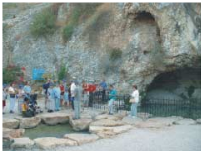
De bron van de beek waar God de strijders van Gideon selecteerde

Van Megiddo gingen we naar een park waar een bron ontspringt die volgens de traditie de plek is waar Gideon op Gods bevel de soldaten selecteerde die mochten meevechten tegen de vijand. 300 man die op een bepaalde manier water uit de beek dronken, was genoeg om Gods plan uit te voeren. Heel wat visvijvers, dadelpalmen, bananenplantages en een paar honderd luchtdansende, naar Afrika trekkende ooievaars later, kwamen we op ons prachtige nachtverblijf: het vakantiedorp van Kibbutz Ma'agan. We werden ondergebracht in prachtige 2-persoons huisjes langs de oever van het meer van Galilea, Kinneret, de "harp". De maaltijd was heerlijk. De volle maan gaf prachtige contouren aan de dadelpalmen boven onze huisjes en -nog weer hoger- aan de donkere rand van de heuvels rechts van het meer. Aan de overkant van het meer flonkerde goud en wit de stad Tiberias. We waren op een prachtige plek beland.