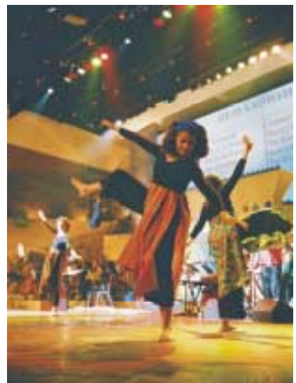
Danseres op het podium