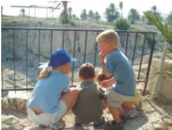
De jongste deelnemers vermaken zich in Megiddo

Er zijn drie noord-zuid verbindingen in Israël. De Via Mare of kustweg, door de Jizraëlvallei en door de Jordaanvallei. Om de controle van de Via Mare is meermalen in de geschiedenis door legertjes gevochten om zo de handelsroute van de rijkbeladen karavanen in handen te hebben. Via een dwarsverbinding -weg 5- gingen we naar onze volgende bestemming in de Jizraëlvallei. Megiddo is een Tell: een oudheidkundige heuvel van eeuwenlang laag over laag weer opgebouwde woonlagen. We beklommen het hoogste punt van Megiddo, vanwaar je de Jizraëlvallei (60 km. lang -bijna tot aan Jeruzalem) voor een deel kon overzien. Het toekomstige toneel van de laatste strijd tussen de machten van God en van het kwaad, Satan. Volgens de uitleg bij de maquette van het oude Megiddo zien de Joden deze plaats als een teken