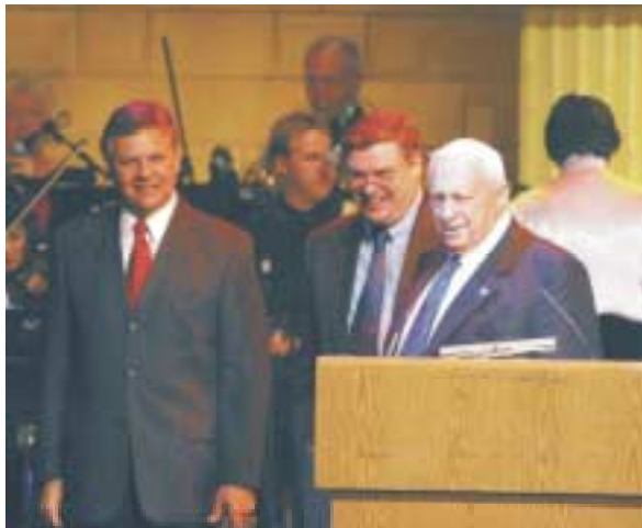
Premier Sharon wordt verwelkomd door de deelnemers van het Loofhuttenfeest

Na het verlaten van de Citadel gaan we naar het restaurant van Christ Church om daar de lunch te gebruiken. Na de lunch vervolgen we onze weg door de joodse wijk richting Klaagmuur, waar we kort de gelegenheid hebben om rond te kijken, te bidden, enz. Met de taxi worden we weer naar het hotel gereden waar ons een heerlijk diner wacht.