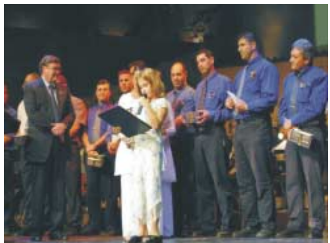
50 buschauffeurs worden in het zonnetje gezet