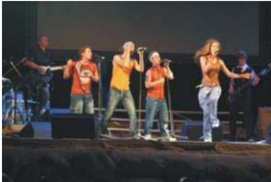
De Duitse Hip-Hop band Normal Generation?

Nadat het gewone programma afgelopen was besteeg de Duitse Hip-Hop band 'Normal generation?' het podium. "Put your hands in the air. Celebration everywhere", schalde het. De muziekstijl veranderde, het aantal decibellen steeg, maar de atmosfeer van aanbidding bleef. God is een veelkleurige God. Omdat we in Jeruzalem nog moesten inchecken, konden we niet lang meer blijven.