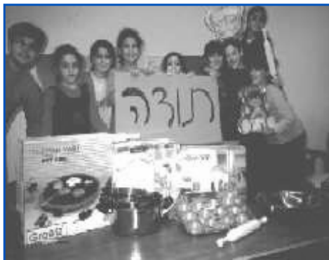
Kinderen zeggen 'Todah' (dank je)

Er komen nog steeds Joodse mensen naar Israël uit allerlei landen, die allerlei vreemde talen spreken. Ze leren de vernieuwde Hebreeuwse taal, dienen in het Israëliësch leger en krijgen sabra (in Israël geboren) kinderen. Ze integreren in het maatschappelijk leven en bouwen een nieuw bestaan op. Ze vormen niet langer een minderheid, maar zijn Joden in een Joods land.